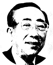
尾張旭市市長 谷口幸治

終わりに、同窓会の先生方のますますのご健勝とご活躍を祈念いたしますとともに、今後とも変わらぬご指導、ご支援を賜りますようお願い申し上げます。